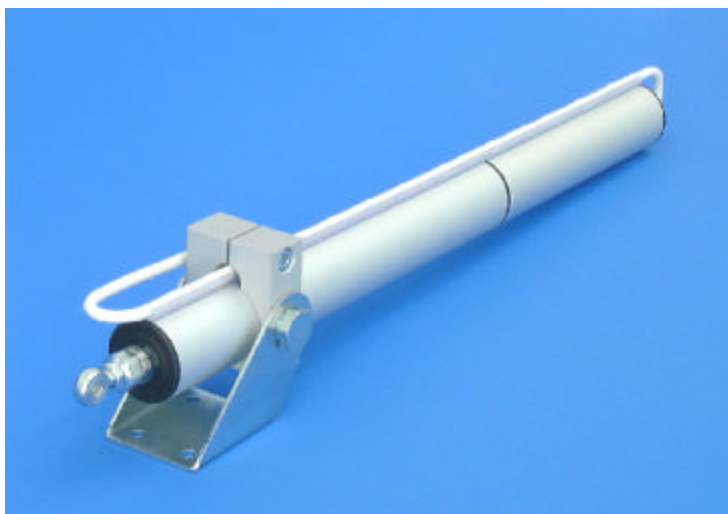
Antrieb SG 100 RK-W S